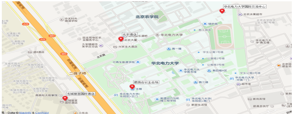
图 2、红色标注为会议所需重要地点（局部图）